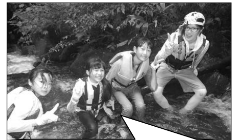
ふるさとの自然の中で、たくさんの友達といろいろな体験ができるヨ！