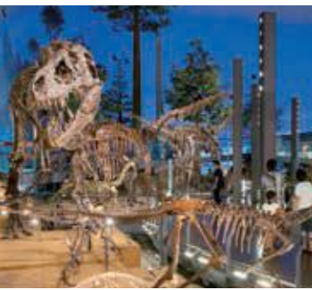
福井県立恐竜博物館