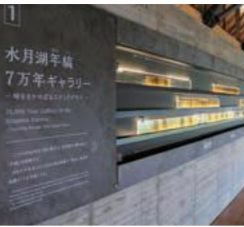
福井県年縞博物館

このパンフレットは、福井県内の旅館や民宿が企画した「平日特典」をPRするために作成したものです。