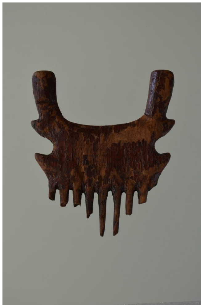
鳥浜貝塚 赤色漆塗り櫛 若狭歴史博物館（国指定重要文化財）