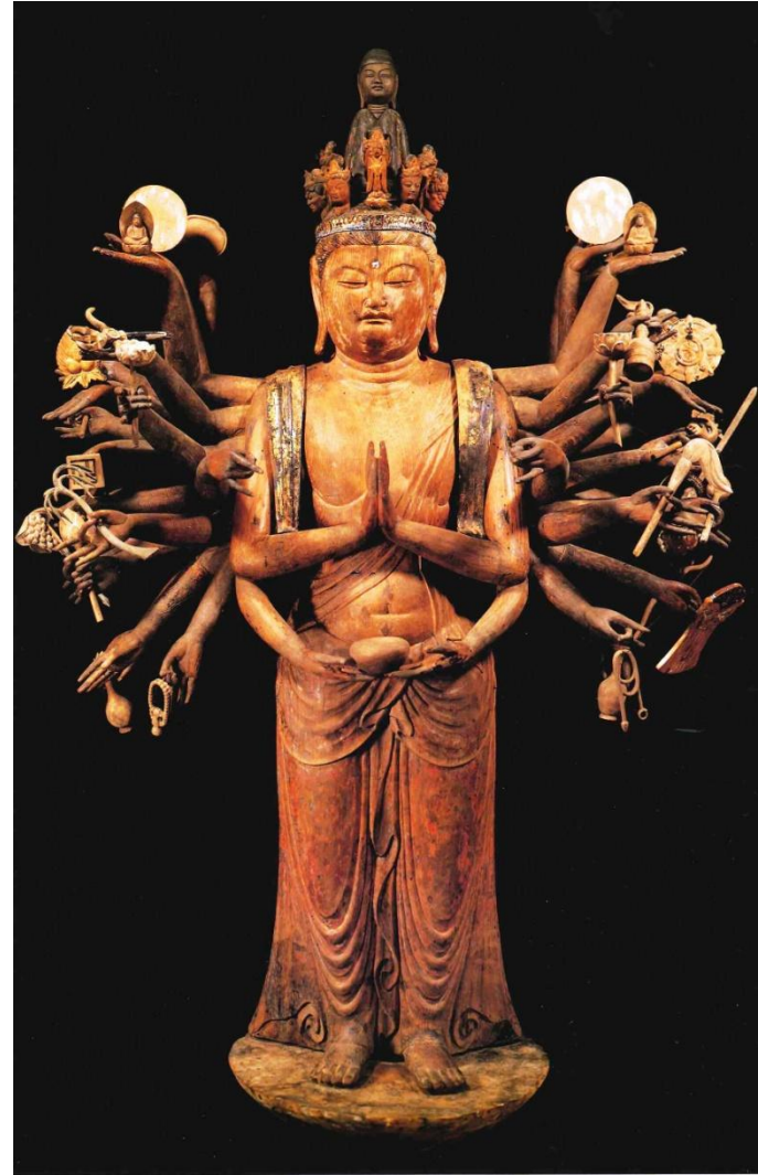
木造千手観音立像 加茂神社為星寺（国指定重要文化財）