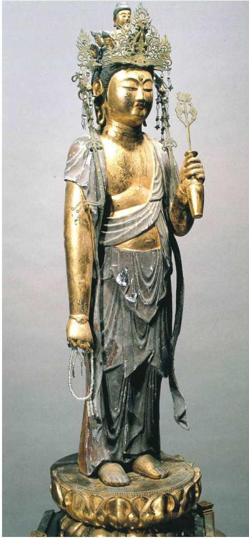
木造十一面観音立像 藤井天満宮（若狭町指定）