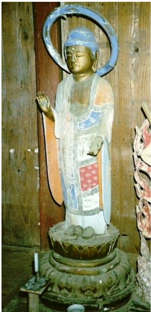
★初公開 木造薬師如来立像 黒駒区