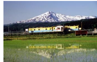
由利本荘市の見所、鳥海山

★お知らせ 歴史家・作家の加来耕三氏が講師を務める講演会「福井から明治維新150年を考える」 日時:平成28年7月3日(日)13:00～14:30 場所:福井県国際交流会館(福井市宝永)(要申込み) ※同日、同会場で15時から加来氏による小中学生向けの“おもしろ歴史クイズ大会”を開催します。