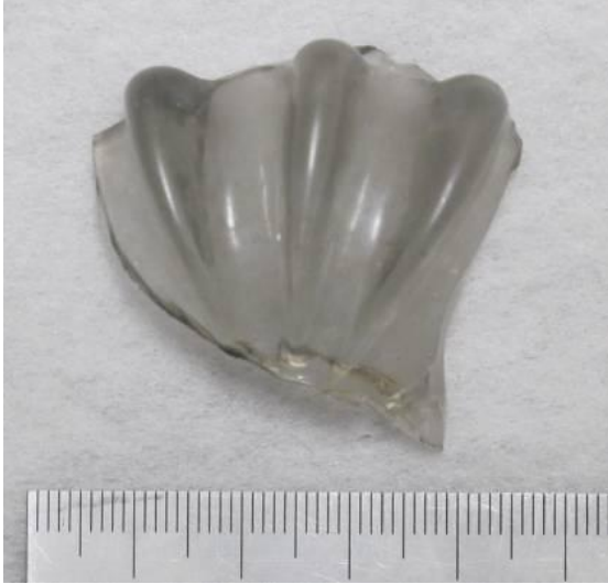
＜重要文化財＞リブ付装飾ガラス容器 (日本最古のヴェネチアン・ガラス)