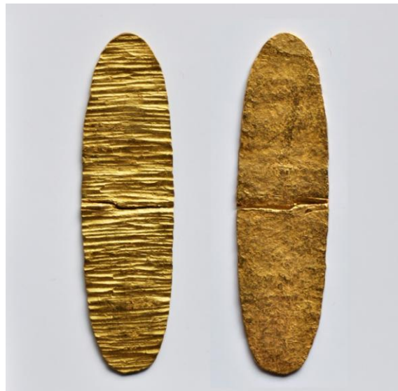
一乗谷朝倉氏遺跡出土蛭藻金