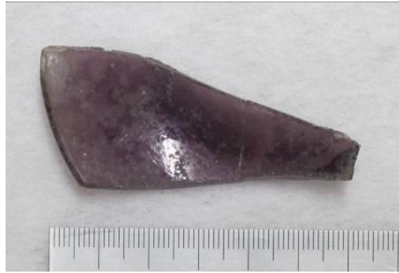
色付きガラス皿 (戦国時代で唯一の色付きガラス)