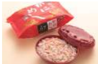
越前冷凍かにめし

ふわふわジュシーで、トースターで焼いたらまるでクロワッサンのようにサクサク、一品で満足できる、福井名物「竹田の油揚げ」です。原料にもこだわり、一枚一枚丁寧に揚げられています。