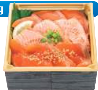
ふくい名水サーモン三色丼