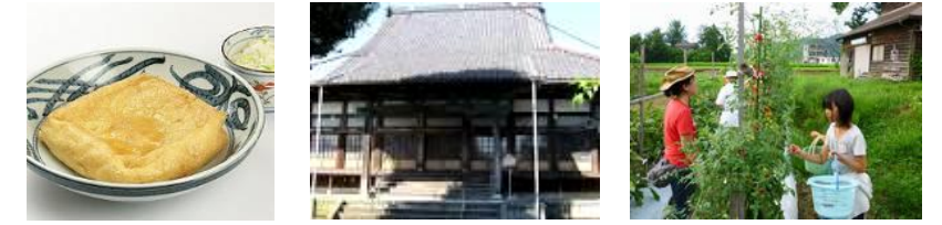
東郷のまち歩き、農家民泊等の推進 [H26～] (民泊実施農家：5軒)