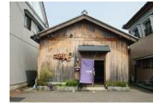
東郷地区での観光案内・住民活動拠点整備 [H26～]