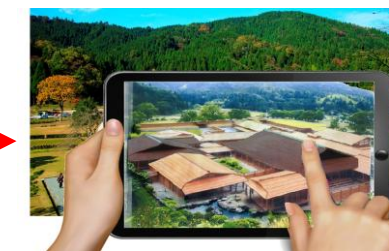
(タブレット端末で中世の城下町の様子を見学) 中世の城下町を立体画像で忠実に再現し、実風景に合成 [H27]