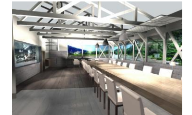
朝倉亭 和食レストランの整備 【H27.10 完成予定】