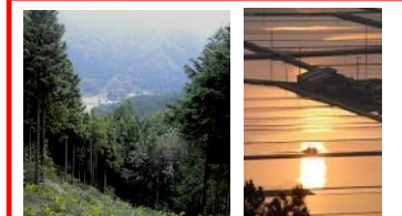
【レキガツツの実現H27～】 看板の設置、遊歩道や橋の修繕 (住民団体が実施)