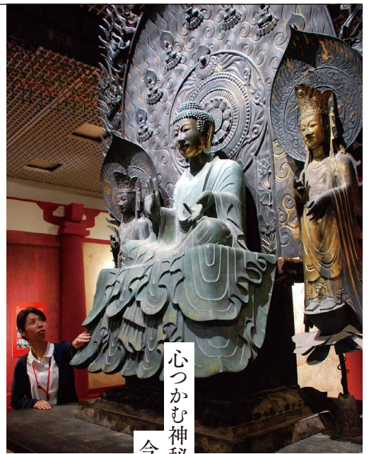
《法隆寺 釈迦三尊像》再現