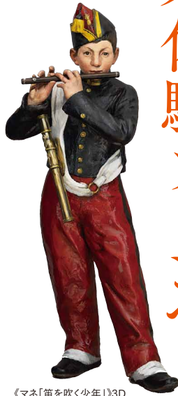
《マネ「笛を吹く少年」》3D