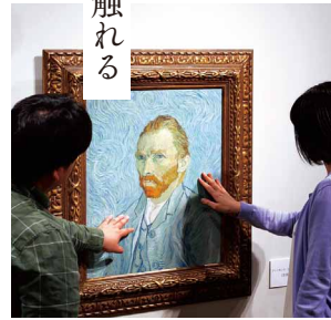
《フィンセント・ファン・ゴッホ「自画像」》再現