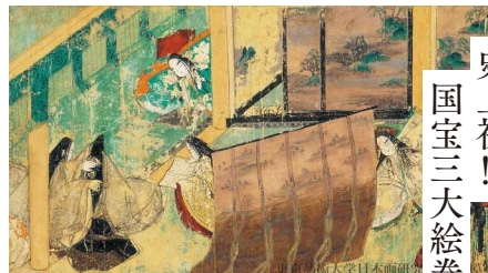
《源氏物語絵巻 第五十帖 東屋一 絵》現状模写