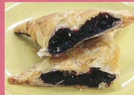
瑞香園（あわら市） 手作りブルーベリーパイ 他