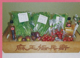
麻王伝兵衛（あわら市） 越のルビー 他