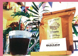
UchiLaLa（ウチララ）（あわら市） コーヒー、ジュース 他