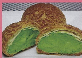
堀川製茶（あわら市） 宇治抹茶クッキー・シュークリーム 他