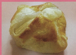
甘党本陣 嵯峨（あわら市） もちパイ 他