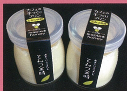
メープルハニー（福井市） とみつ金時プリン