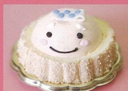
西洋菓子倶楽部（坂井市） マルシェ限定スイーツ 他