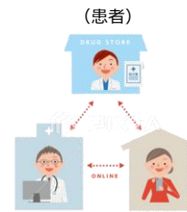
（患者） （医師） （薬局）